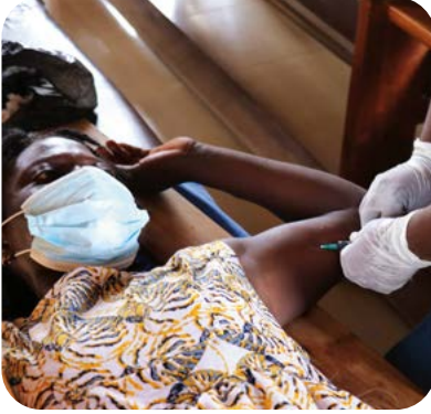
Ghana UNFPA ©

تحتل الموارد الأساسية دوراً رئيسياً في ضمان وصول وسائل منع الحمل إلى النساء والفتيات في أمس الحاجة إليها. ففي بلدان مثل غانا، تُستخدم الموارد الأساسية لتوصيل مستلزمات تنظيم الأسرة إلى أبعد نقطة مهما نأت. ويوفّر برنامج «شراكة الإمدادات»، البرنامج الرائد لصندوق الأمم المتحدة للسكان، المسمى الشراكة في الإمدادات، ووسائل منع الحمل الحديثة والأدوية التي تمنع ملايين حالات الحمل غير المرغوب فيه كل عام. كما تمكّن الموارد الأساسية من مواصلة تسليم هذه المستلزمات وتوافرها، مما يساعد البلدان على تلافى نفاذ مخزونها، ويكفل قدرة الصندوق على إيصالها إلى المجتمعات المحلية النائية على نحو يمكن التنبؤ به وبكفاءة.