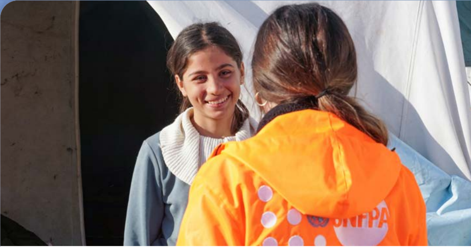
Türkiye/Eren Korkmaz UNFPA ©

في أعقاب الزلازل المدمرة في تركيا وسوريا في شباط / فبراير 2023، استخدم صندوق الأمم المتحدة للسكان الموارد الأساسية من أجل الاستجابة السريعة للاحتياجات الملحة لدى النساء والفتيات. وقد بيّرت هذه الموارد تقديم الإمدادات والخدمات المنقذة للحياة، وخاصة بالنسبة للنساء الحوامل واللاجئين. ففي المراحل الأولى من الأزمة، ساعدت الموارد الأساسية التي قدّمها صندوق الأمم المتحدة للسكان في تعزيز وإعادة نشر سبع وحدات خدمة في المحافظات المتضررة، ودعم قدرة السلطات الصحية المحلية على توفير الخدمات المتنقلة للصحة الإنجابية وتوزيع أكثر من 12,000 حقيبة من حقائب اللوازم الصحية النسائية على النساء في أماكن الإقامة المؤقتة.