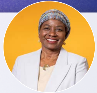
د. ناتاليا كانيم المديرة التنفيذية لصندوق الأمم المتحدة للسكان

"في عالمنا الذي يتغير بسرعة، يجب على صندوق الأمم المتحدة للسكان أن يتحرك بسرعة ومرونة أيضاً. حيث يمنحنا التمويل الأساسي المرونة لتنفيذ استجابة سريعة لمواجهة التحديات غير المتوقعة. ويكفل استمرارية المحافظة على رؤية الصندوق ويبقى الأساس الصلب لما نحققه من نتائج بشكل جماعي".