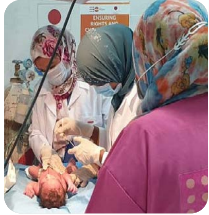
Libya UNFPA ©

استخدم صندوق الأمم المتحدة للسكان الموارد الأساسية لنشر وحدات صحية متنقلة في المناطق النائية من ليبيا منذ عام 2018. توفر هذه الوحدات الصحية المتنقلة خدمات صحة الأم والوليد الأساسية، وإدارة الحالات الطبية للناجين من العنف القائم على النوع الاجتماعي، والاستشارات العامة والإسعافات الأولية. وتتكون الفرق من أطباء التوليد وأمراض النساء، وأطباء الأطفال، والقابلات وغيرهم من المهنيين في مجال الصحة. أدت المبادرة إلى خفض معدل وفيات