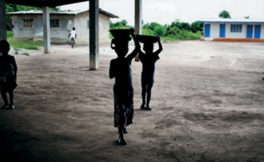
▲ Дети, несущие воду своим матерям на рынке на окраине Монровии, Либерия. На этом рынке, построенном при поддержке ЮНФПА, женщины и их дети ограждены от домогательств и надругательств.