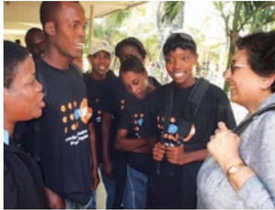
◀ Директор-исполнитель ЮНФПА встречается с молодыми гаитянками, проверяющими уровень недооказания среди матерей и детей, в Центре Гескио в Порт-о-Пренсе в марте 2010 года

Переход от развития к кризису и обратно со всей очевидностью свидетельствует о том, что любые действия по обеспечению развития смягчают влияние кризисов и стихийных бедствий. Эта связь становится очевидной, когда мы сравниваем последствия недавних