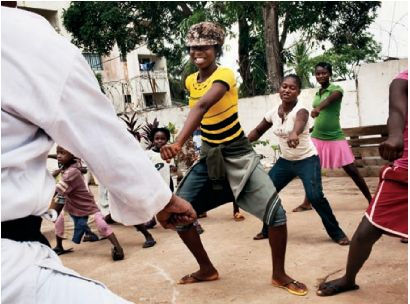
▲ Женщины-полицейские обучают молодых либерийских женщин в Монровии приемам самообороны.

как женщины сумели потребовать прекратить гражданскую войну.