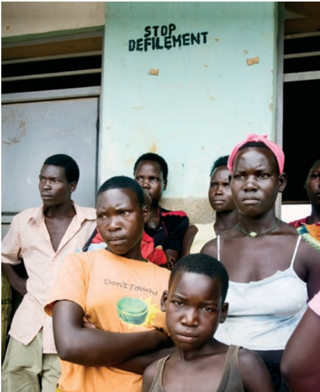
◀ Группа молодых людей перед школой Амуру, Уганда.