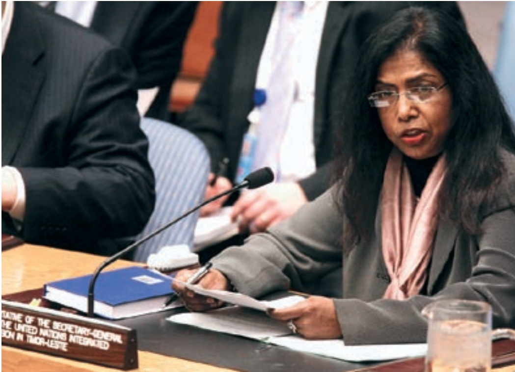
◀ Специальный представитель Генерального секретаря по Тимору-Лешти и глава Интегрированной миссии Организации Объединенных Наций в Тиморе-Лешти (ИМООНТ) Амира Хак выступает в Совете Безопасности.