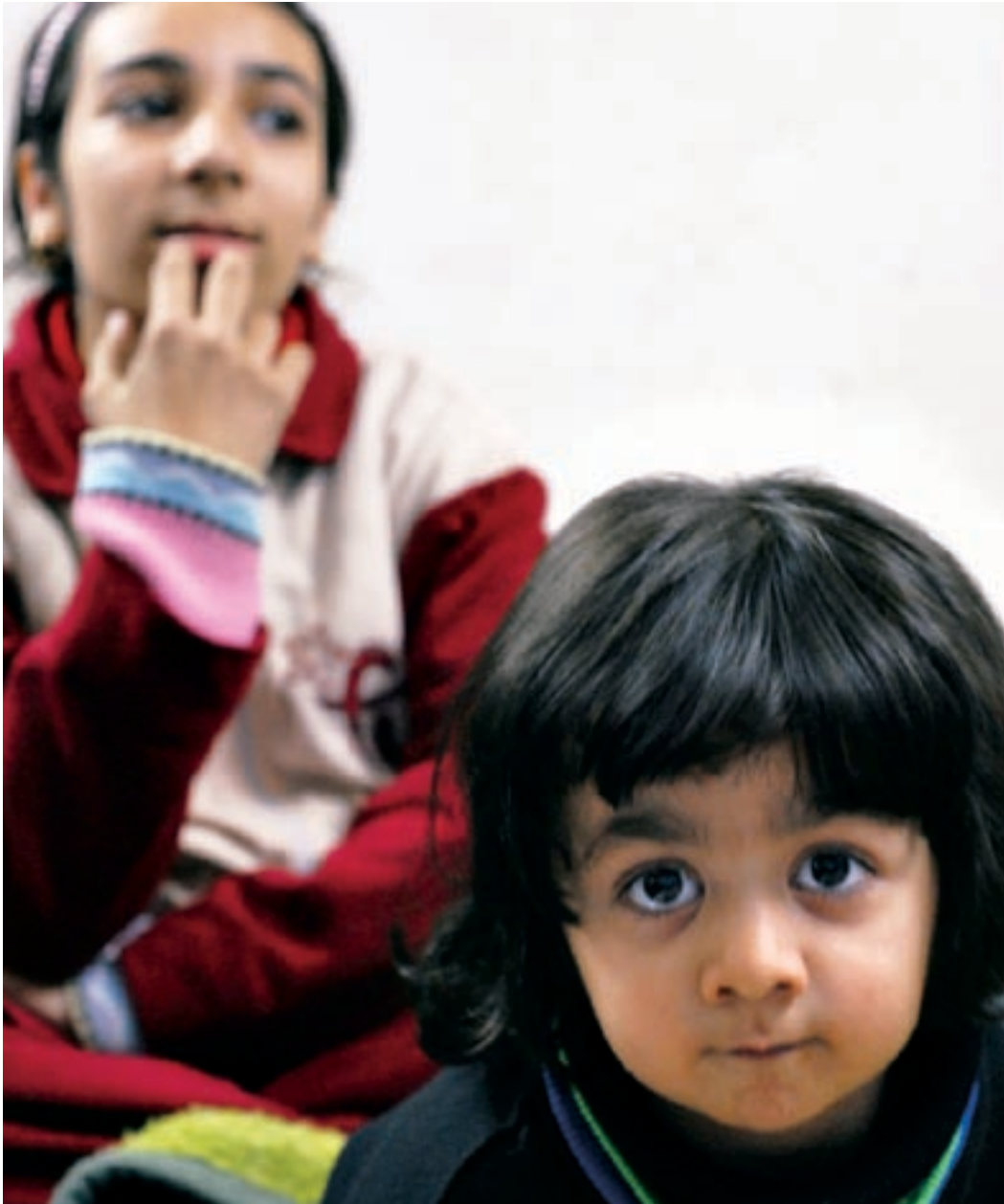
◀ Иракские сестры в своем доме в Аммане, Иордания.