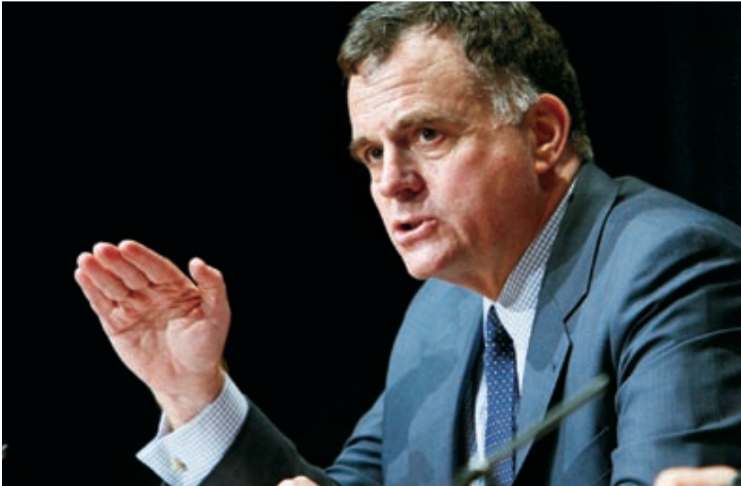
◀ Помощник Администратора Программы развития Организации Объединенных Наций и Директор Бюро по предотвращению кризисных ситуаций и восстановлению Джордан Райан: «Кроме того, гендерное насилие — это одно из главных препятствий на пути реализации женщинами своих экономических прав в семье и за ее пределами».

зом вопросами безопасности в узком смысле этого слова, устранить надлежащим образом источники нестабильности и уязвимости в Гаити не удастся».