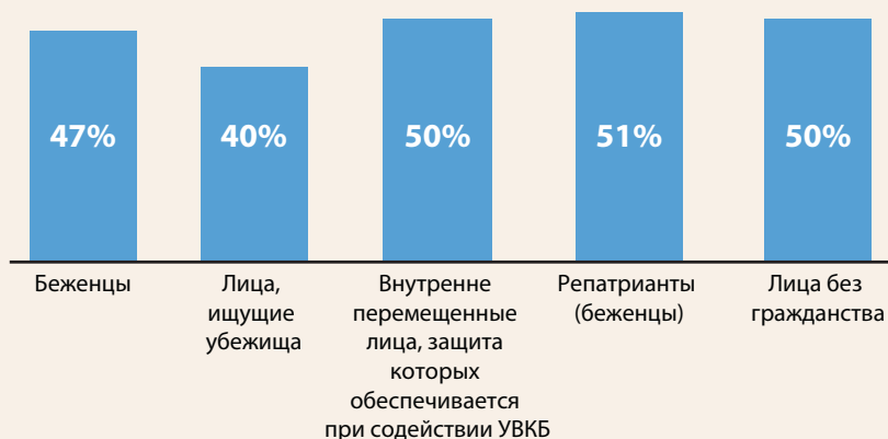
Доля женщин в разбивке по категориям на конец 2009 года