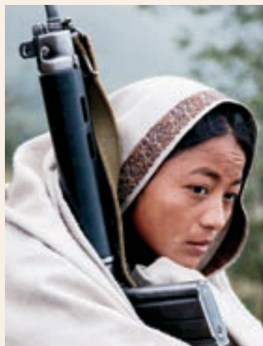
Участница боевых действий-маоистка в Бходжпуре, Непал, в 2005 году.